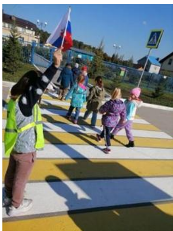
Работа с родителями